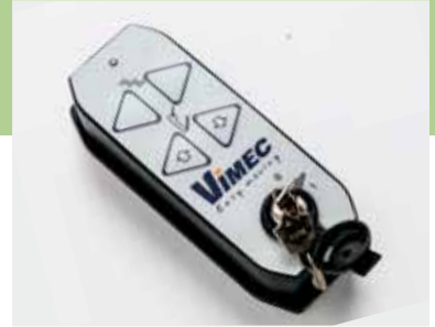
Mando via radio