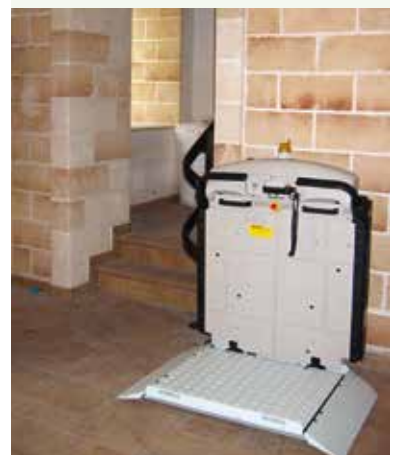
V65 con barras retráctiles

con plataforma decididamente amplia, para toda necesidad de desplazamiento.