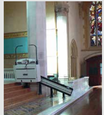
V64 con apertura automatizada