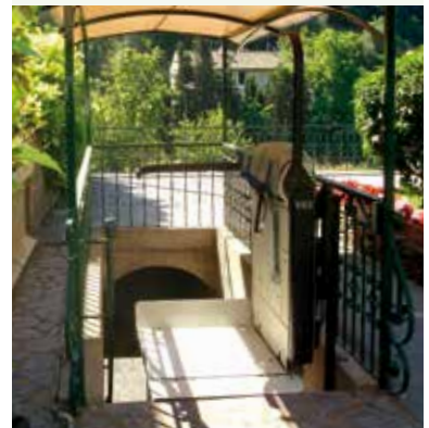
V65 con barras independientes

Los salvaescaleras V64 y V65 cuentan con mando radio, dispositivos para la protección personal activos y pasivos de vanguardia y barras de protección retráctiles para reducir las dimensiones con máquina detenida.